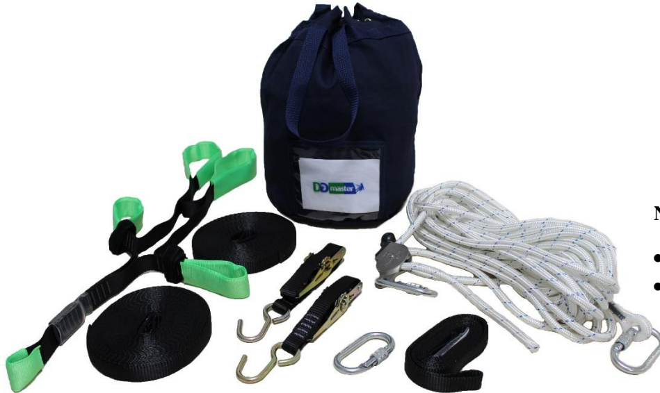
Imagens meramente ilustrativa

Atende diversos tamanhos de escada (consulte a DGmaster), pode ser usada em postes e também paredes que possuam pontos de ancoragem para fixação da escada e da linha de vida vertical.