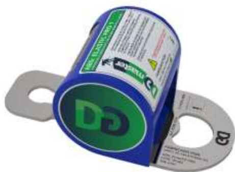
Imagem meramente ilustrativa pode haver alteração nas cores

O Absorvedor de energia Elastisk foi desenvolvido para uso específico em linhas de vida horizontais, tanto fixas como temporárias, tem como objetivo criar um sistema de absorção de energia que proporciona uma segurança adicional para as ancoragens e a estrutura que está montado a linha de vida, absorvendo a energia gerada da queda do trabalhador.